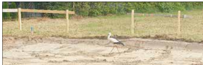
Wenn das kein gutes Zeichen ist?