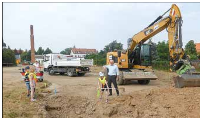
Spatenstich Kita-Neubau Falkenhain

Auf Wunsch der Kindergartenkinder der KITA Falkenhain haben wir trotz der geltenden gesellschaftlichen Einschränkungen den ganz wichtigen 1. Spatenstich auf der Baustelle vollzogen. Der Elan der Kiddies war unglaublich. Selbst unsere Falkenhainer Störche ließen es sich nicht nehmen, dem Spatenstich beizuwohnen und die Baugrube zu inspizieren.