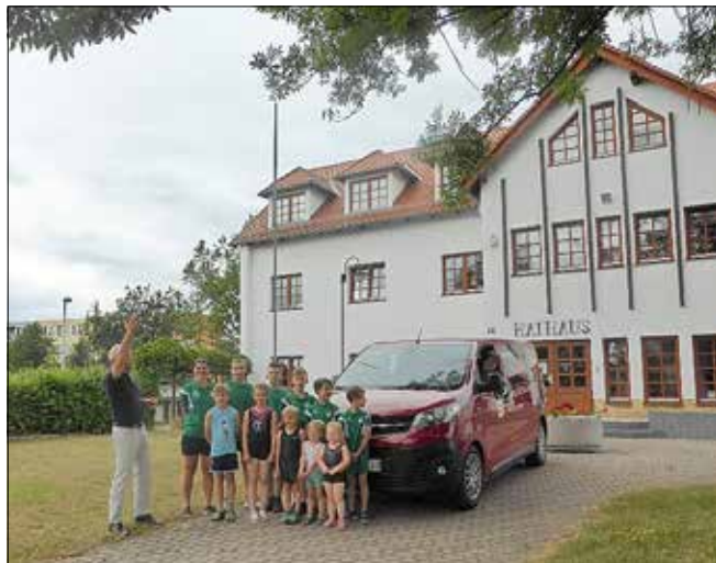
Übergabe des Kleinbusses

Jüngst erhielten wir von der Sparkasse Muldental in Verbindung mit der PS-Lotterie einen Kleinbus geschenkt. Anlass war die Vielzahl an Nachwuchsfeuerwehrleuten in unseren 5 Jugendfeuerwehren und die großen Nachwuchsabteilungen in unseren Sportvereinen. Hier gibt es ab sofort eine deutliche Erleichterung bei gegenseitigen Besuchen zu Feuerwehrdiensten oder der Fahrt zu Nachwuchsturnieren in anderen Gemeinden. Ich wünsche unseren kleinen Feuerwehrleuten und Nachwuchssportlern viel Spaß und Erfolg mit dem Fahrzeug.