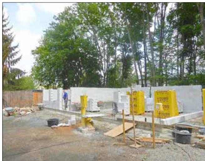
Foto: Rohbau „Wirtschaftsgebäude“ Tiergehege Dornreichenbach

Das Kulturhaus Hohburg ist fertiggestellt, das Tiergehege Dornreichenbach kommt gut voran und der Neubau der Kita Falkenhain ist gestartet. Wir werden berichten.