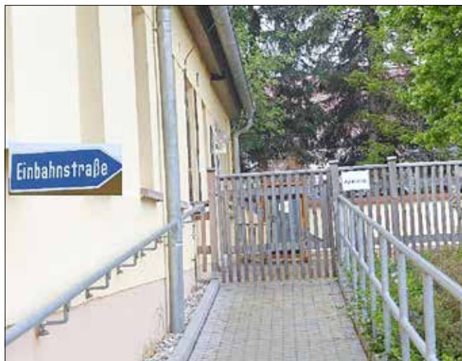
Foto: Eiscafé Hohburg – kreative Umsetzung der Corona-Vorschriften

Sehr gefreut hat mich die wochenlange Tendenz im Lossatal mit Null Corona-Infizierten und in Quarantäne Befindlichen. Danke Ihnen allen für die gezeigte Disziplin bei der Umsetzung der Allgemeinverfügungen. Aber – noch sind wir nicht wieder im Normalzustand.