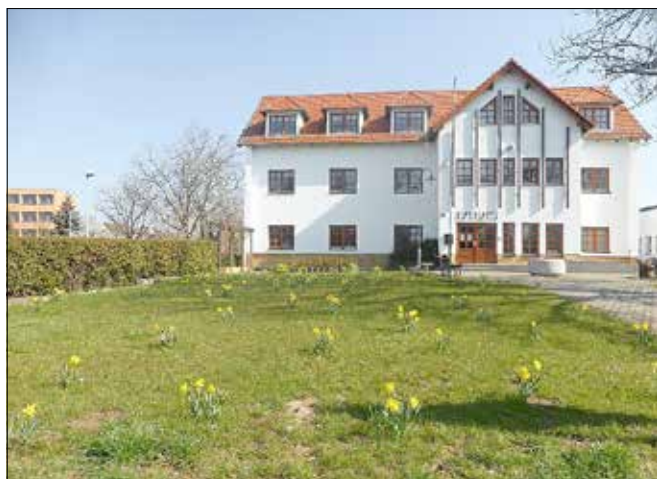
Ergebnis der gesponserten Blumenzwiebeln der Firma Blumen Senf

Unser Lossatal war über viele Tage hinweg frei von infizierten und unter Quarantäne gestellten Personen. Ein erster Achtungserfolg, der uns aber nicht leichtsinnig machen sollte. Die Pandemie ist nicht zu unterschätzen, und es ist durchaus damit zu rechnen, dass eine zweite oder dritte Welle entstehen kann. Schauen Sie sich die Solidarität und Hilfsbereitschaft der Menschen hier bei uns im ländlichen Raum an, so bin ich zuversichtlich, dass wir diese Prüfung, Corona zu besiegen, gemeinsam schaffen werden. Es ist unbeschreiblich, wie sich quer durch alle Altersgruppen Hilfsangebote strukturieren, die unseren Risikogruppen zu allererst ihre Hilfe anbieten. Und genau das ist im Moment aus meiner Sicht das Wichtigste, einer ist für den anderen da, unabhängig von Alter, Geschlecht, Herkunft oder sozialer Stellung – denn für das Virus sind wir alle gleich.