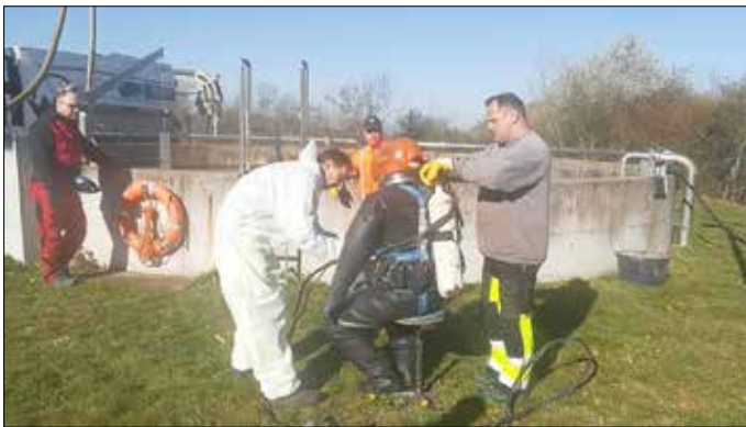
Taucher bei der Vorbereitung für den Tauchgang

Am 06. und 07.04.2020 ist ein Taucher im Belebungsbecken der zentralen Kläranlage in Kleinzschepa auf Grund gegangen, um den Wechsel der sogenannten Belüfterkerzen vorzubereiten. Eine Aufgabe, die während des laufenden Betriebes zu erledigen ist und die in der Folge die Energiekosten der Anlage merklich senken soll.