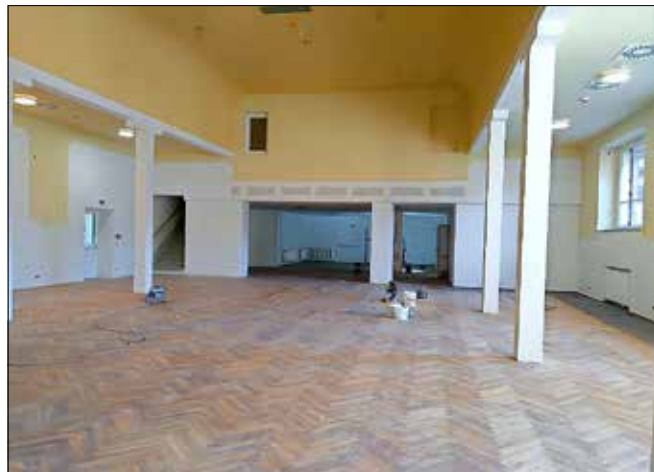
Rekonstruktion Großer Saal im Kulturhaus „Hohburger Schweiz“

Auch hier muss das Prinzip der Solidarität, der Starke hilft dem Schwachen, gelten, ansonsten haben wir gegen Corona und ihre Nachwirkungen keine Chance.