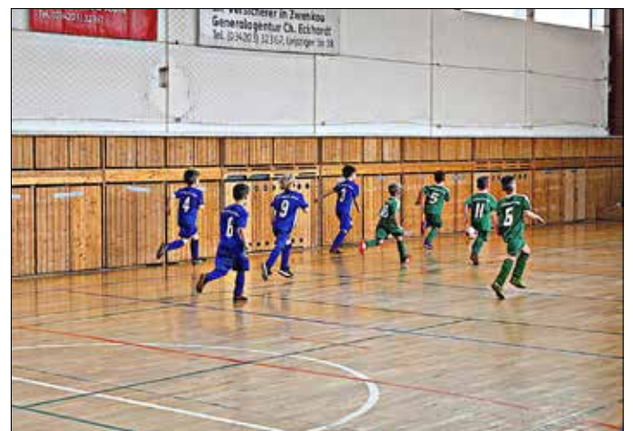
Alle dem Ball hinterher - das ist Bambini-Fußball

Am dritten Januarwochenende lud der SV Zschepplin zu seinem Hallenturnier ein. Mit am Start waren neben den F-Junioren (2. Platz), der E-Jugend (6. Platz) und der D-Jugend (3. Platz) auch die Mini-Kicker vom Falkenhainer SV.