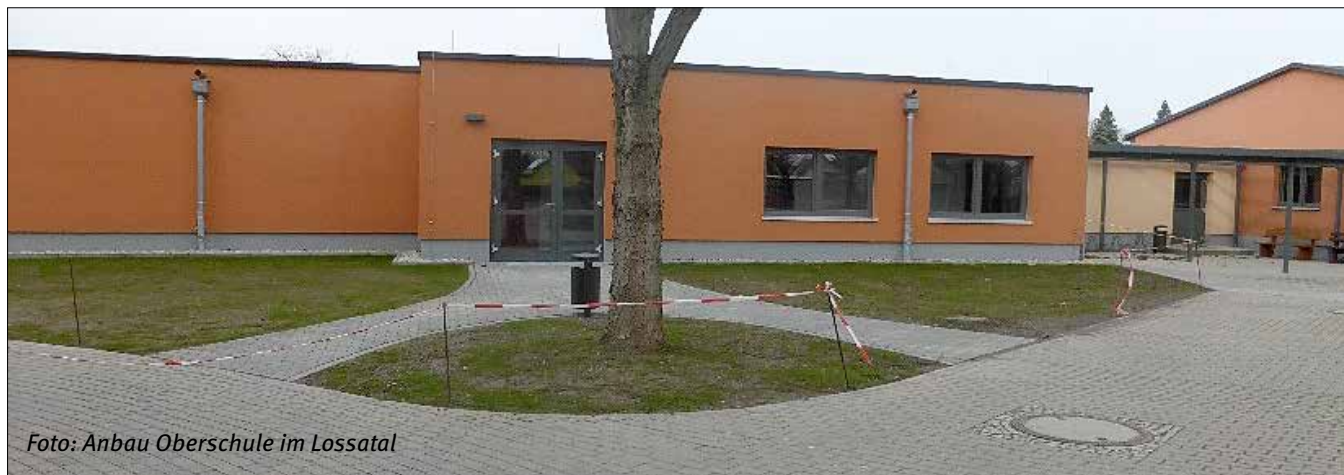
Foto: Anbau Oberschule im Lossatal