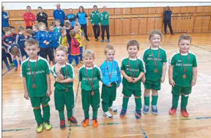
Stolz mit der Medaille um den Hals

Angefeuert von den mitgereisten Eltern und Großeltern, entwickelten sich viele hart umkämpfte Duelle. Am Ende konnte sich fast jedes der Falkenhainer Kinder in die Torschützenliste eintragen und zur Siegerehrung bekam jedes Kind eine Medaille umgehängt. Die Endplatzierung spielte da gar keine Rolle mehr und auch nicht ob man nun ein Spiel verloren oder gewonnen hat. Hauptsache viele Tore wurden geschossen.