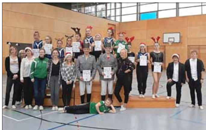
Falkenhainer Turner/innen des 2. Durchganges, Übungsleiter und Kampfrichter