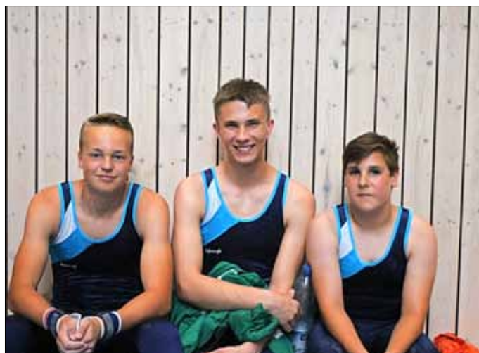
Falkenhainer Turner AK 14 – 17