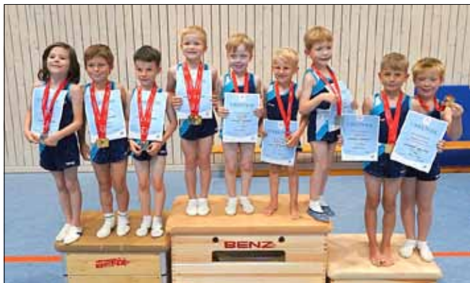
Falkenhainer Turner der Altersklasse 4 – 7