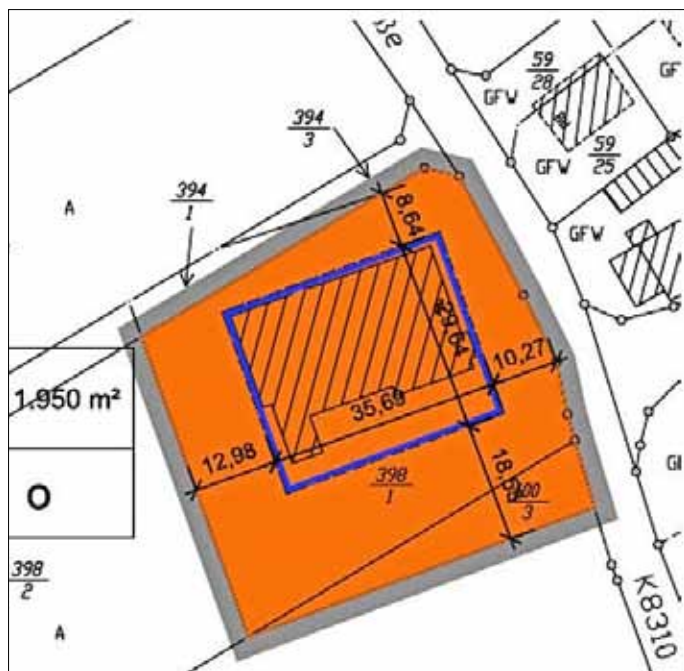
Abb 2.: Ausschnitt aus dem rechtskräftigen B-Plan „Umnutzung ehemalige Kaufhalle in Thammenhain“ v. 12.12.2014