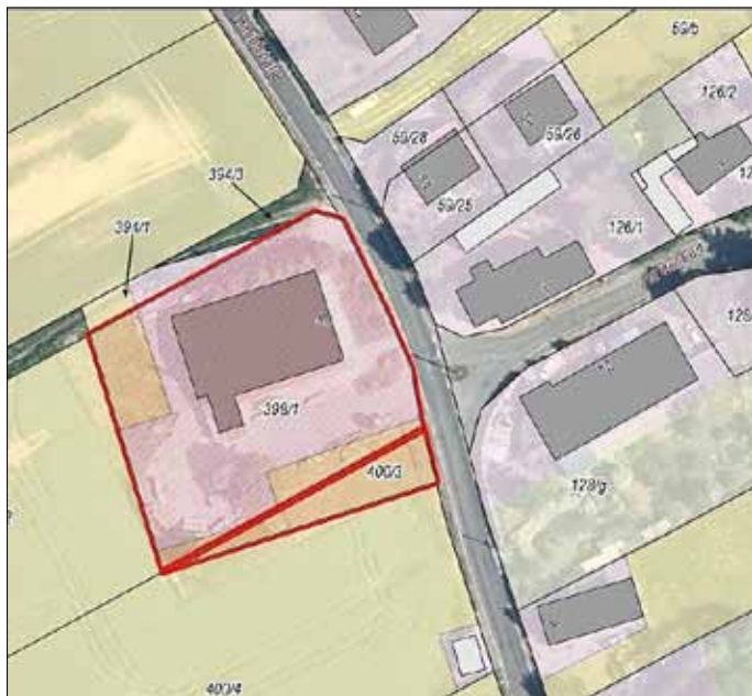
Abb.1: Geltungsbereich des aufzustellenden B-Plan „1. Änderung des vorhabenbezogenen Bebauungsplan Umnutzung ehemalige Kaufhalle in Thammenhain“

zum Beschluss Nr. 63/19-GR des Gemeinderates Lossatal vom 17.07.2019