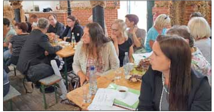
1. Regionalwerkstatt 2018

Die Bürgermeister der Kommunen des Wurzener Landes