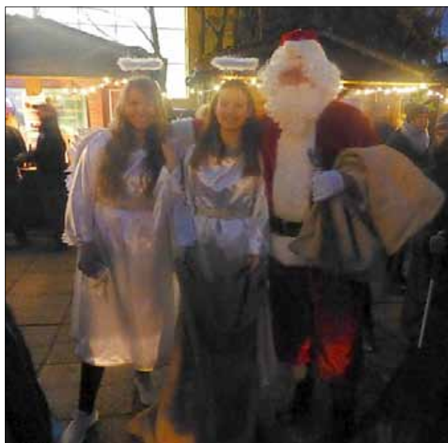
Weihnachtsmann mit seinen 2 Weihnachtsengeln – Bergweihnacht am 09.12.2018

Nun ist es ja seit vielen Jahren Tradition, dass unsere Neugeborenen von der Gemeinde ein kleines Startguthaben in Form eines Begrüßungsgeldes und ein paar kleine Präsente erhalten.