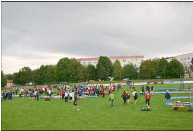
Wanderung zum Schloss