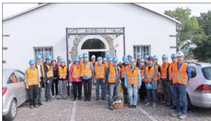
Teilnehmer einer Besichtigungsgruppe