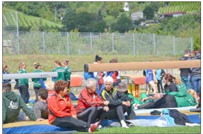
Senioren im Wettkampf