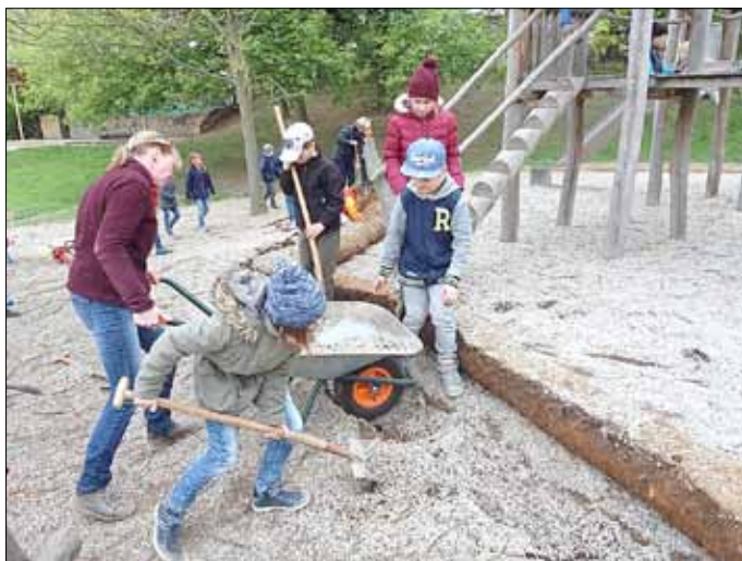
Das Hortteam „Abenteuerland“

Immerhin folgten 17 Eltern von ca. 300 unseren Aufruf, gemeinsam mit uns, den Außenbereich des Hortes in Schuss zu bringen. Was war geplant? Erster Tag: Anhebung der vom Bauhof zu tief gelegten Spielplatzwalze, anschließend Säuberung der Wiese von Kies und Unrat. Zweiter Tag: Farbanstrich der Bänke und Kletterbalken erneuern sowie Rasennachsaat auf der Spielwiese. Letzteres konnte nicht ausgeführt werden, da die Qualität des Bodens zu gering ist und ein Austausch zurzeit aus finanziellen Gründen nicht möglich ist. Nichtsdestotrotz waren die Arbeiten an allen beiden Tagen vorzeitig fertig geworden. Im Namen aller Kinder und Kollegen möchten wir uns ganz herzlich bei allen Eltern für die gelungene Arbeit bedanken.